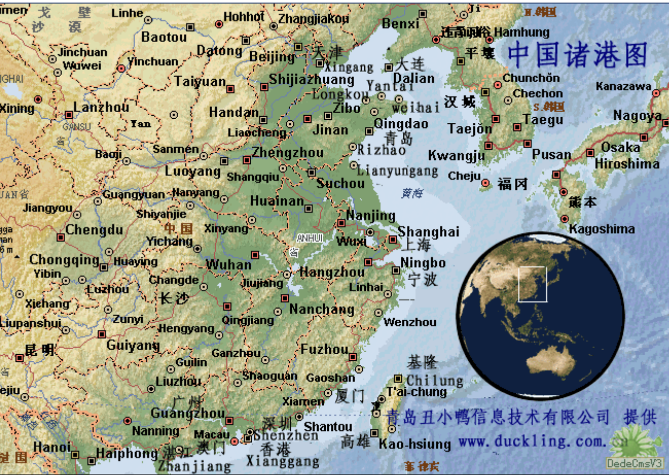
中国国内海运航线图及港口图