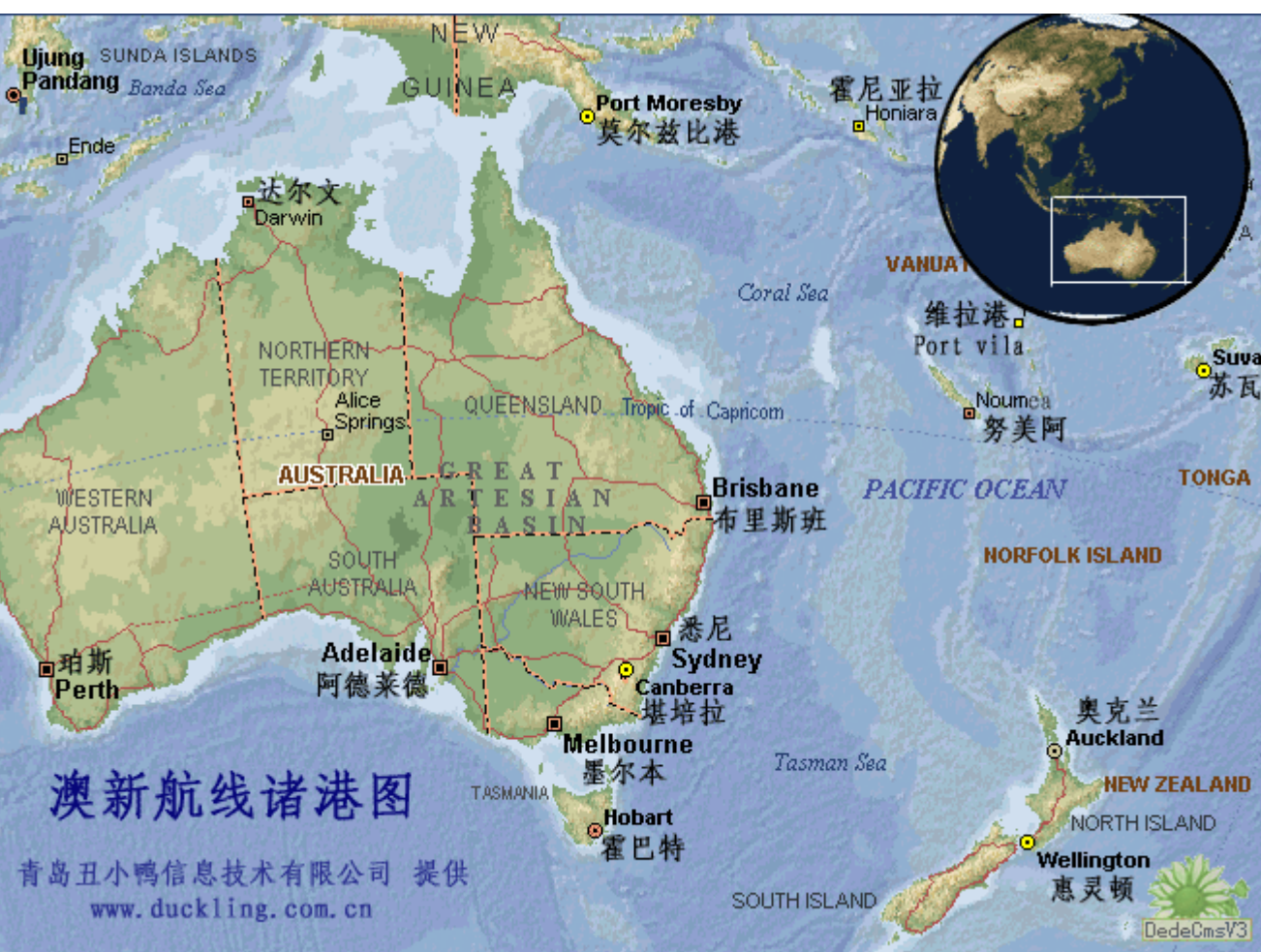
澳新航线及港口图