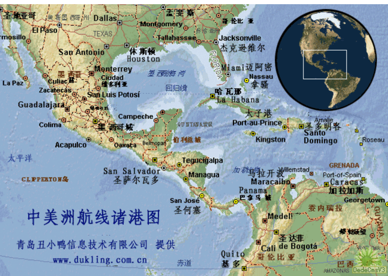
中美洲航线及港口图