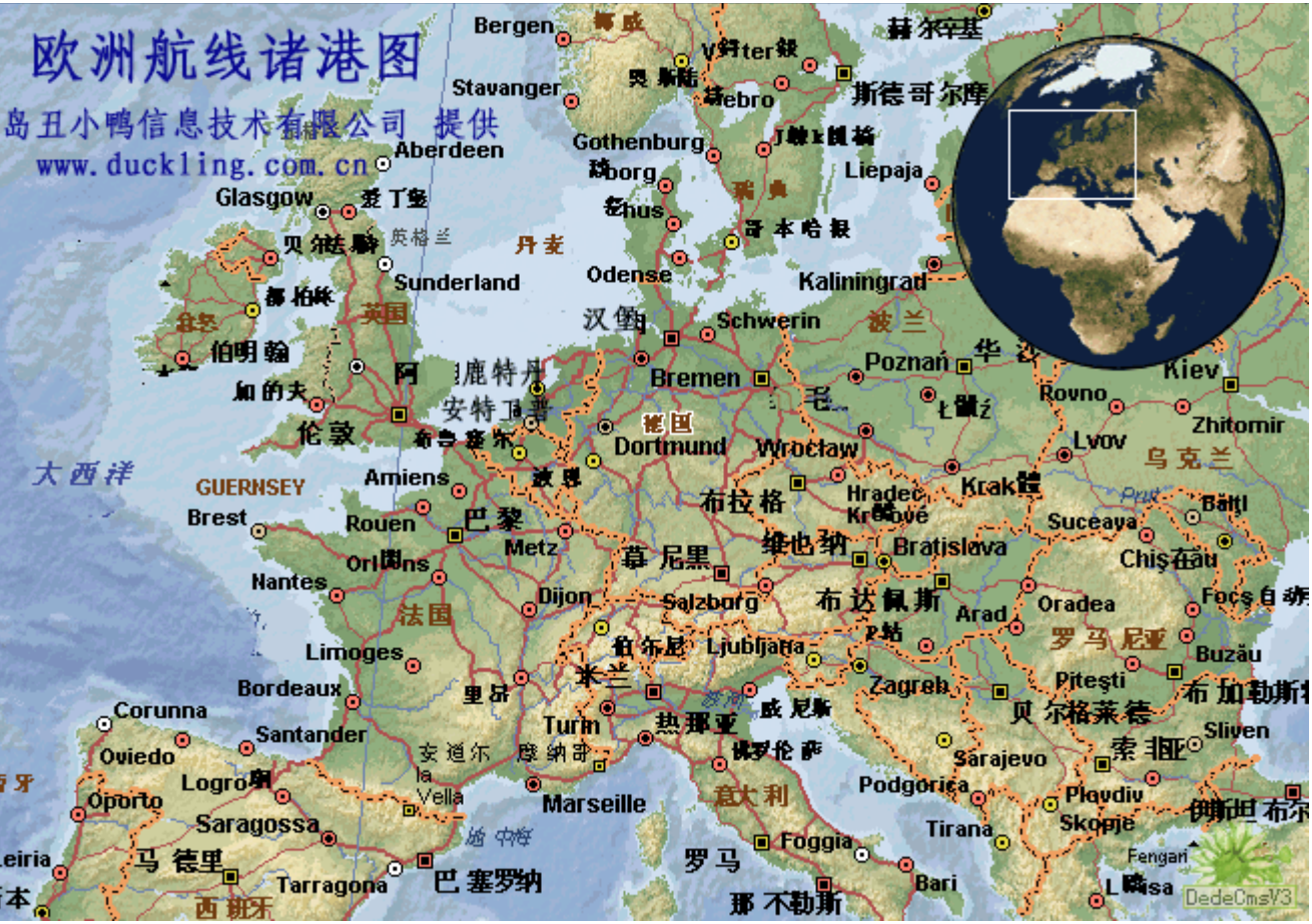
欧洲航线及港口图