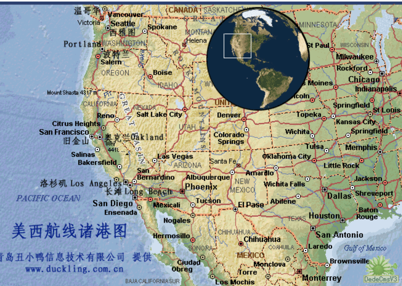
美西航线及港口图