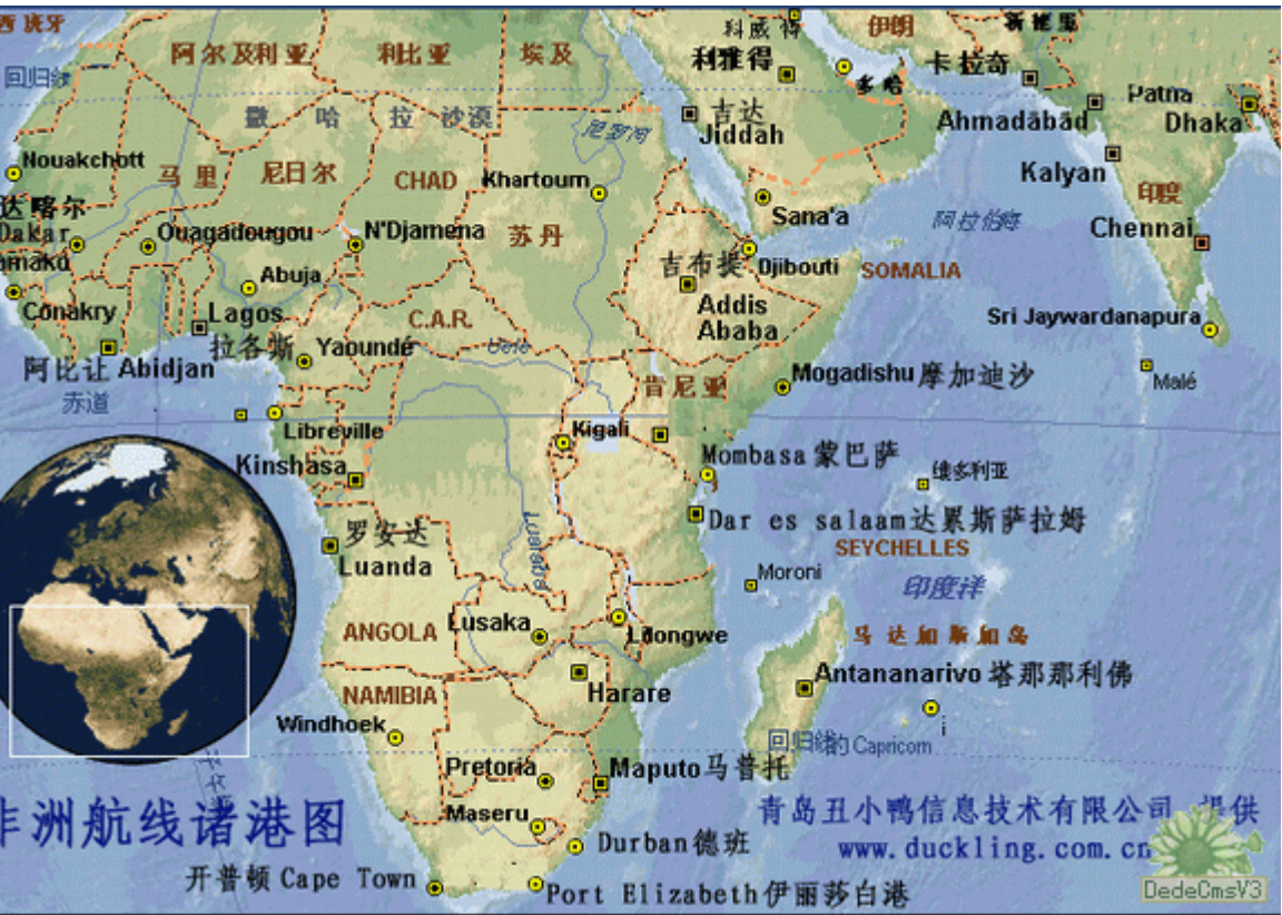
非洲航线及港口图