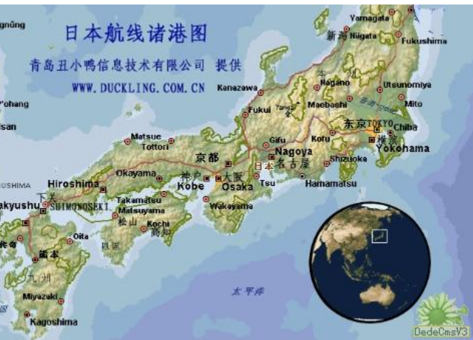
日本航线及港口图