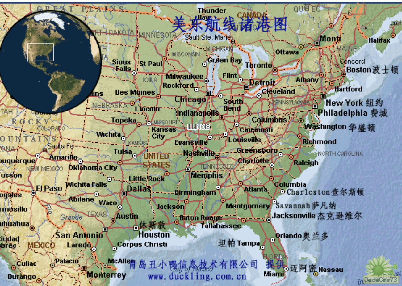
美东航线及港口图