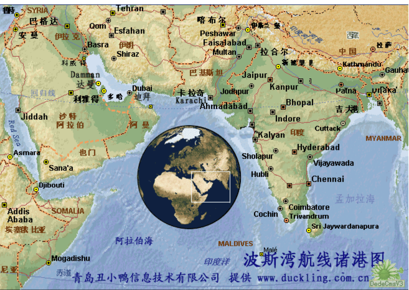
波斯湾航线及港口图