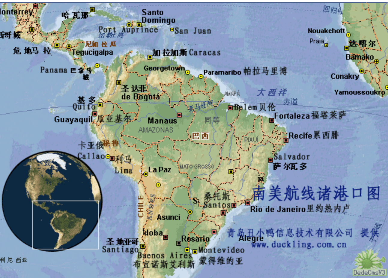
南美航线及港口图